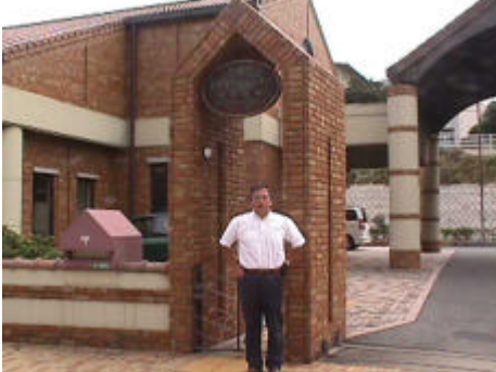
センターの門から玄関へ

6月定例会の一般質問のテーマに選んだ「発達障害」について勉強している間に、知人からこの施設のことを知らされた。自分の目で確かめたくなり、政務調査費を利用し、個人視察として下関市の「こども発達センター」を訪れた。以下がその報告である。